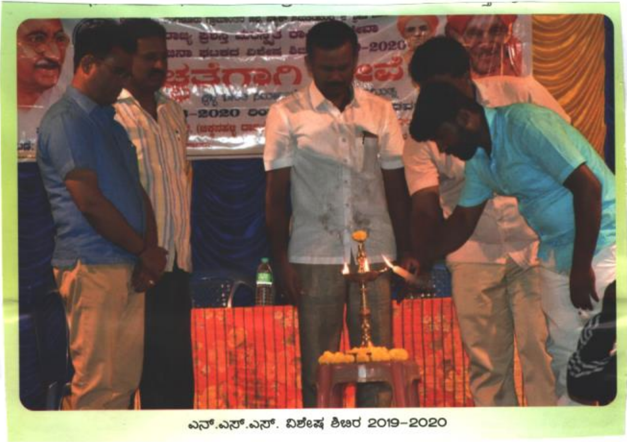
ಎನ್.ಎಸ್.ಎಸ್. ವಿಶೇಷ ಶಿಬಿರ 2019-2020