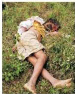
ಚನ್ನಪಟ್ಟಣ, ಕನಕಮಠ ಕಡೆ ಆನೆಗಳ ಕಾಟ ಸಾವು ನೋವುಗಳಿರುವುದು ಸಹಜ ನಿತ್ಯ ಅದರ ಸುದ್ದಿ ಕೂಡ ಪ್ರಕಟ.ಅದರ ಮಾಗಡಿಯಲ್ಲಿ ಇದು ಹೊಸಾ ಬೆಳವಣಿಗೆ ಒಂಟೆ ಸಲಗ ತನ್ನ ಗುಂಪಿನಿಂದ ತಪ್ಪಿಸಿಕೊಂಡು ಬಂದು ಈ ಸಾವಿಗೆ ಕಾರಣವಾಗಿದೆ ಎಂಬುದು ಜನಾಭಿಪ್ರಾಯ.